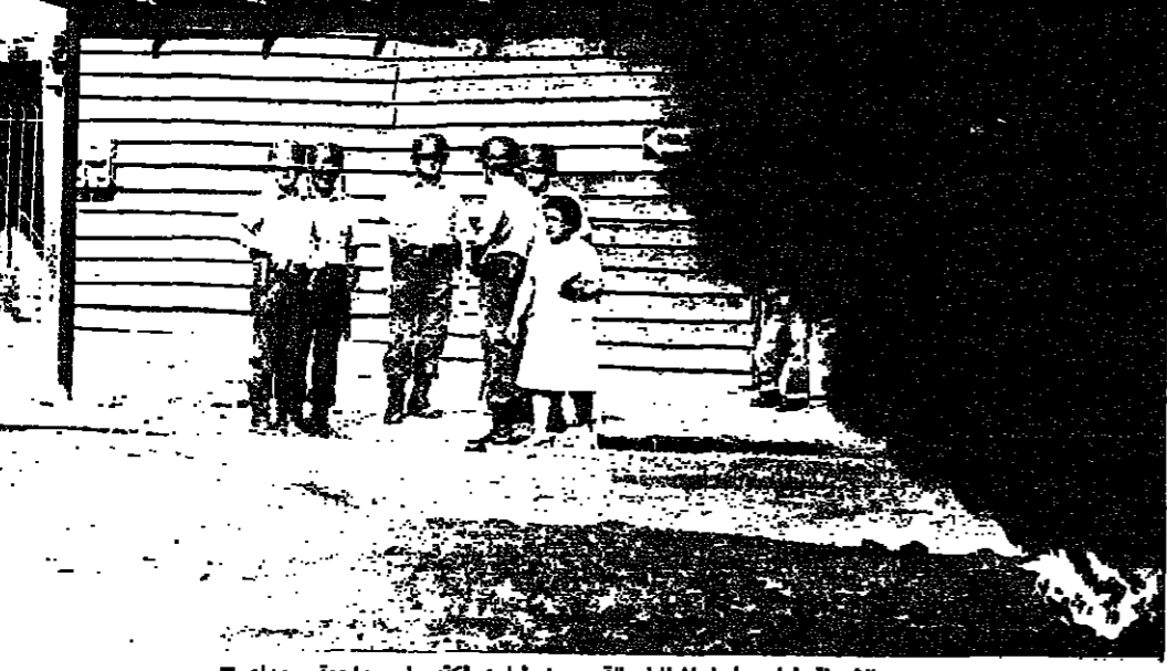
الشرطة امام حاجز الماطم بالقرب من شارع فكتوريا : مواجهة سوداء